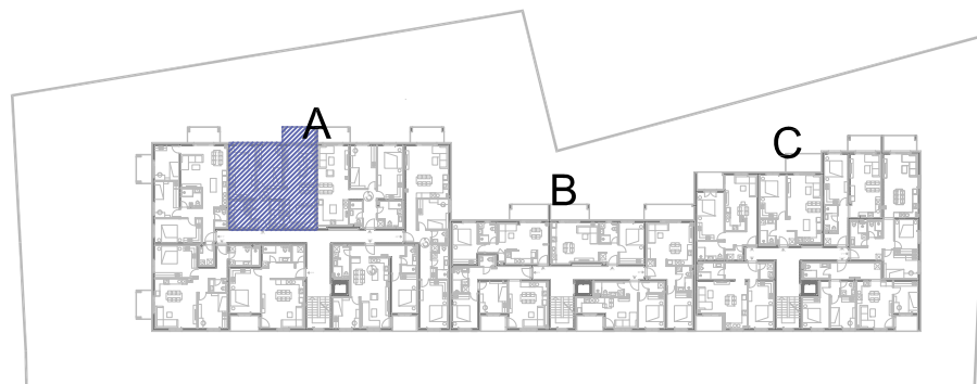
STAN A6, prvi kat, ulaz A