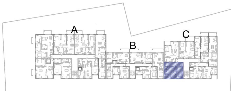
STAN C6, prvi kat, ulaz C