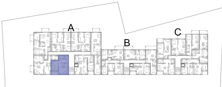
STAN A10, drugi kat, ulaz A