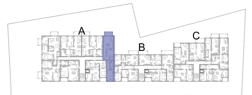
STAN A15, drugi kat, ulaz A